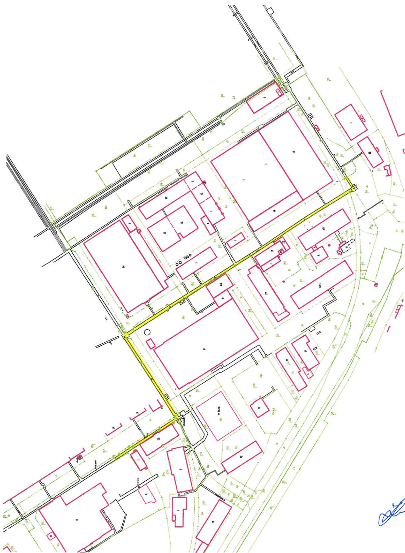
Załącznik nr 1 – lokalizacja kanału podlegająca inwestycji

A handwritten signature in blue ink, located in the bottom right corner of the page. The signature is stylized and appears to be a personal name.