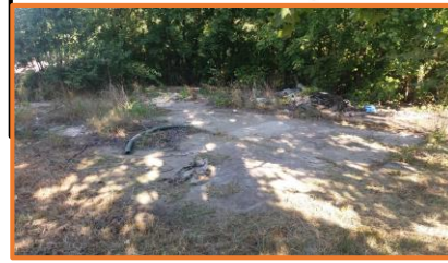
Fundamenty po budynku 91