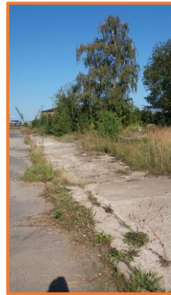
Chodnik betonowy wzdłuż jezdni