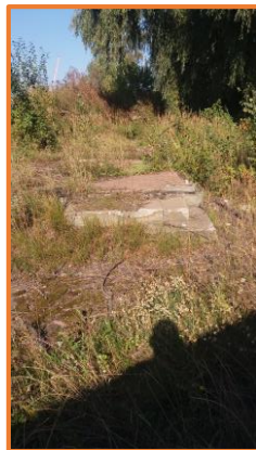
Fundamenty po budynku 122