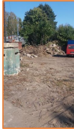
Gruzowisko mieszane z odpadami zielonymi, bunkier