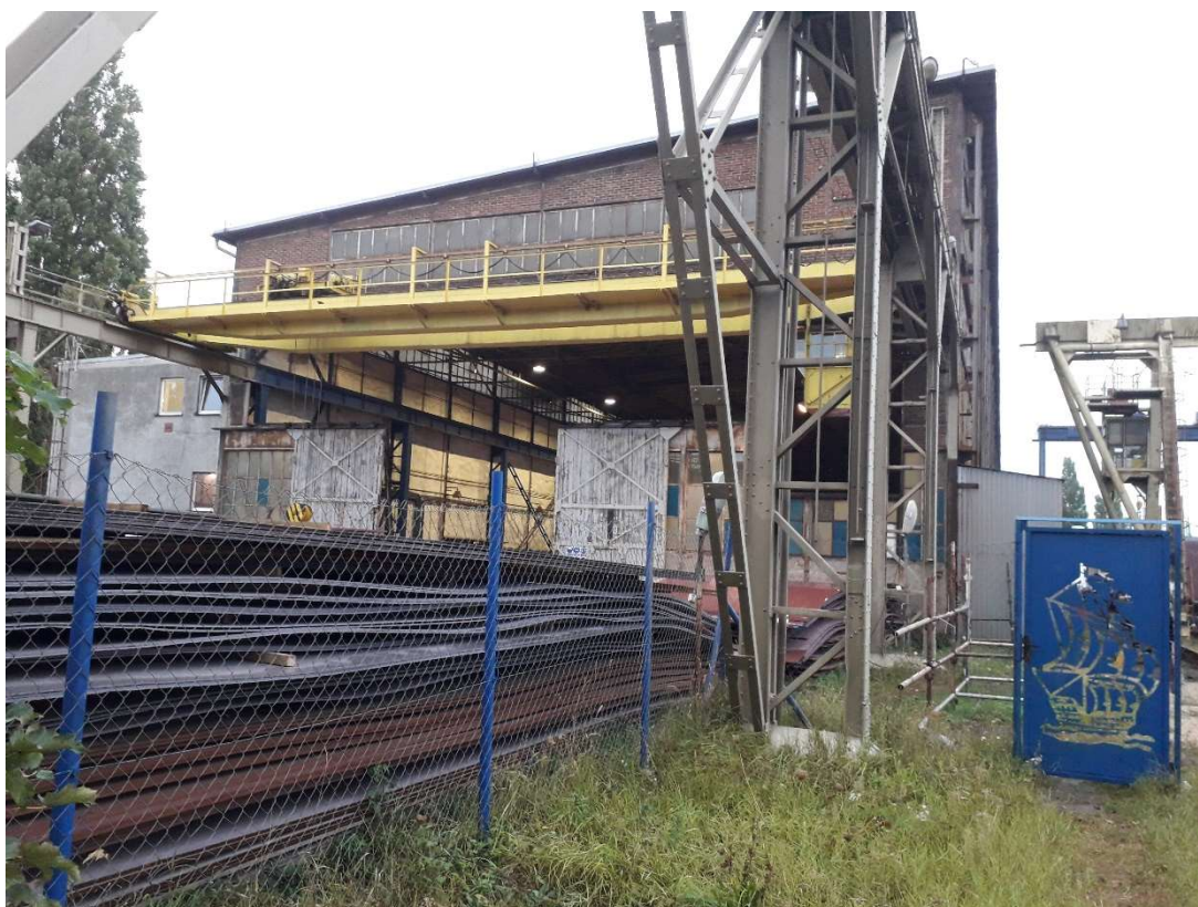
Rys. 3 Widok elewacji szczytowej budynku nr 81 z zasłoną suwnicową otwartą i suwnicą na zewnątrz budynku