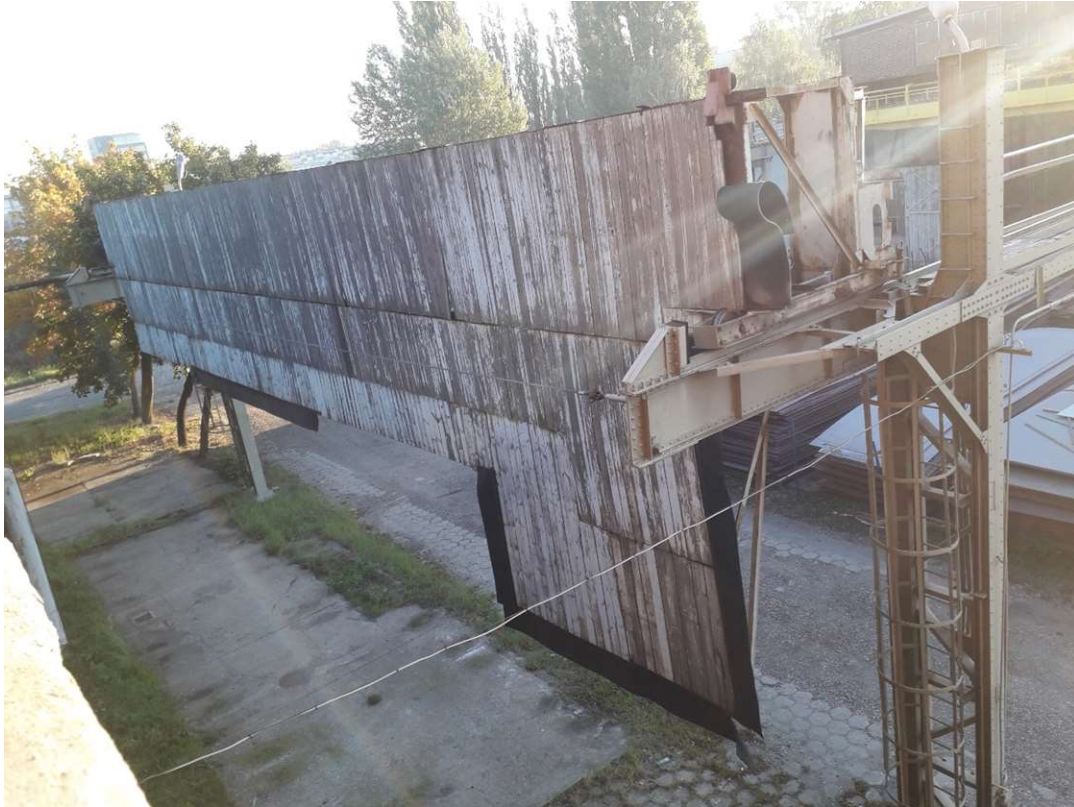
Rys. 4 Widok otwartej zastony suwnicowej – pokrycie drewniane zastony suwnicowej od strony elewacji budynku