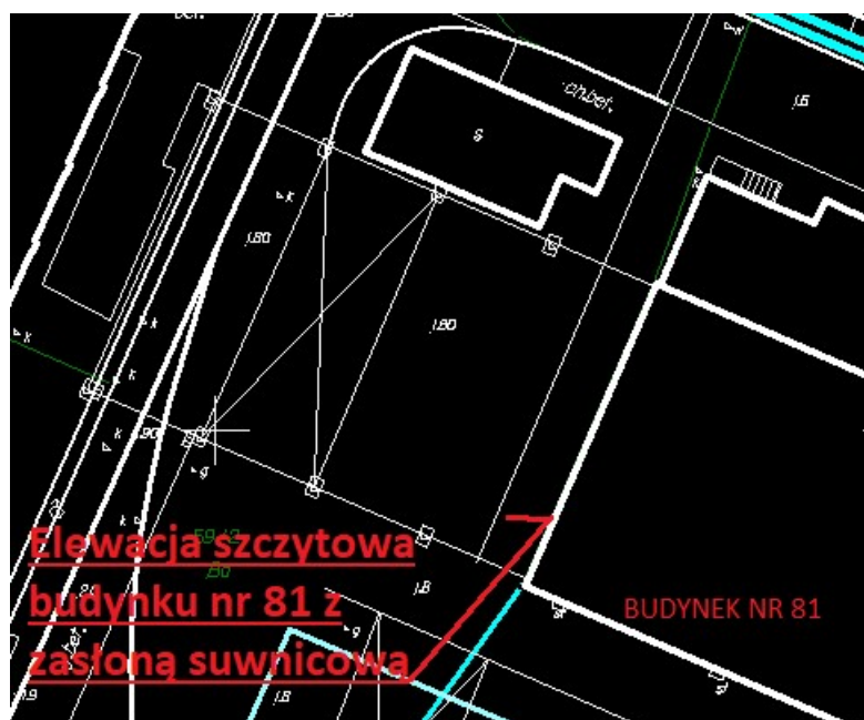
Rys. 1 Lokalizacja elewacji szczytowej budynku nr 81 z zasłoną suwnicową

Przejezdna zasłona suwnicowa może być przesuwana po estakadzie tylko na zewnątrz hali. W skrajnych położeniach zasłony suwnicowej na estakadzie po zewnętrznych stronach toru są zamocowane klocki (odboje), a od strony wewnętrznej toru są zamocowane zderzaki dla zaczepu (brama jest przemieszczana za pomocą suwnicy, która jest wyposażona w urządzenie ryglujące, które kotwi się na sworznich transportowych zainstalowanych na bramie).