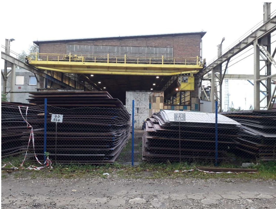
Rys. 2 Widok elewacji szczytowej budynku nr 81 z zasłoną suwnicową otwartą i suwnicą na zewnątrz budynku