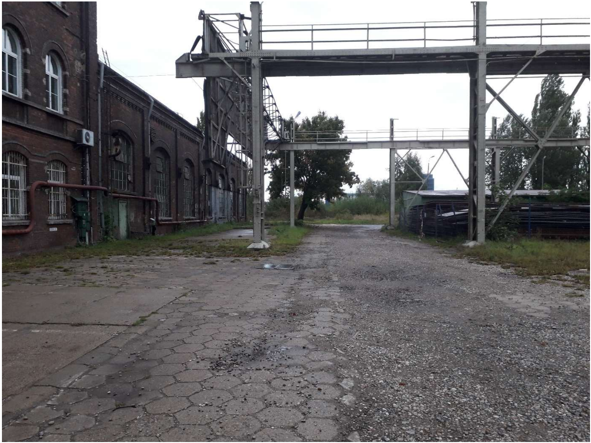
Rys. 6 Widok otwartej zasłony suwnicowej w pozycji krańcowej