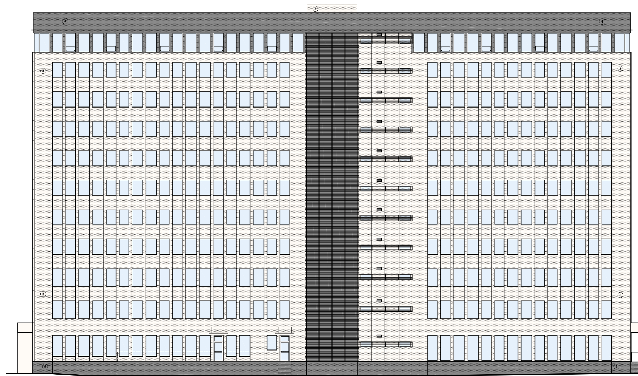
ELEWACJA PN-WSCH skala 1:200