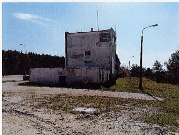
Fot. 7. Fasada północna – zachodnia