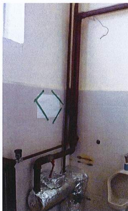
Fot.12. Lokalizacja wodomierza na przyłączy