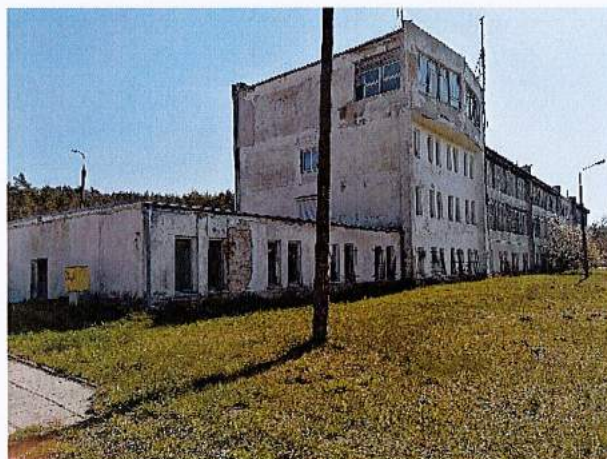
Fot. 6. Fasada południowo-zachodnia