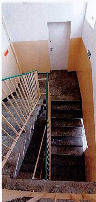
Fot.18 Klatka schodowa