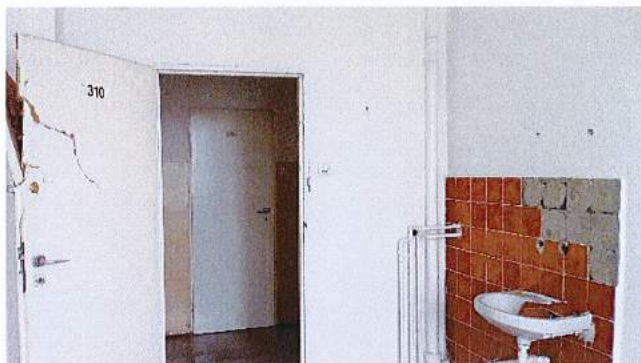
Fot. 11. Sanitariat