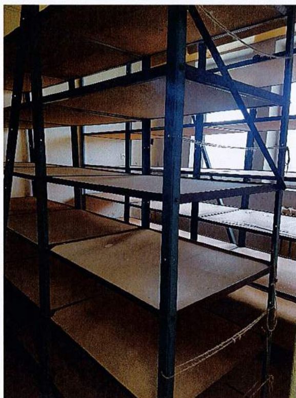
Fot. 15 Przyziemie, pomieszczenie po archiwum