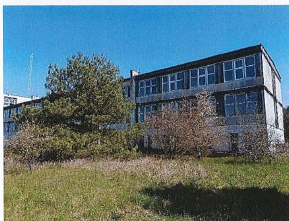
Fot.4. Widok południowo-zachodni