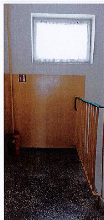
Fot. 19 Klatka schodowa