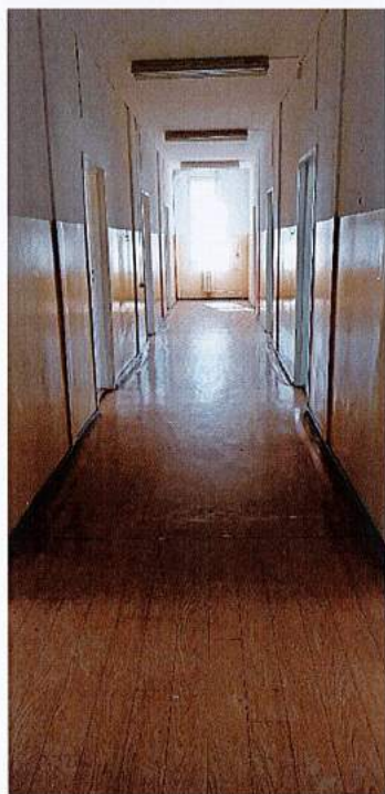
Fot. 17 Korytarz