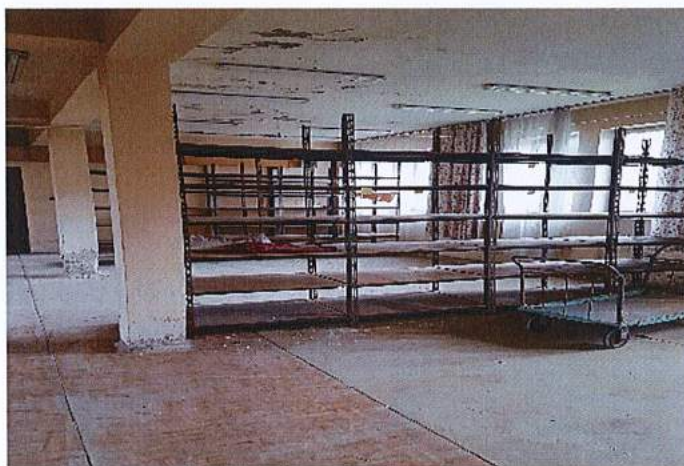
Fot.14. Sala "BHP" przyziemie