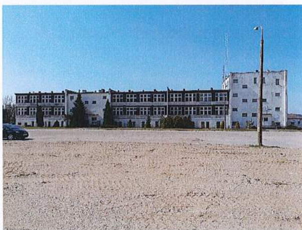
Fot. 1. Fasada północno-wschodnia