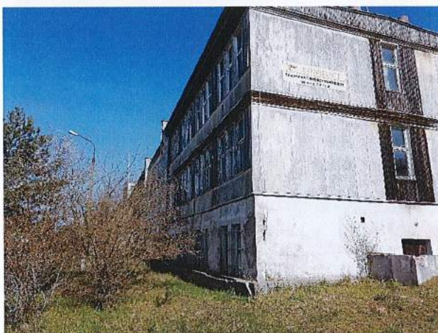
Fot.3. Fasada południowo-wschodnia