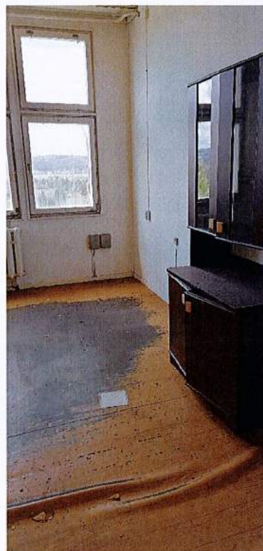
Fot.16 Pokój biurowy