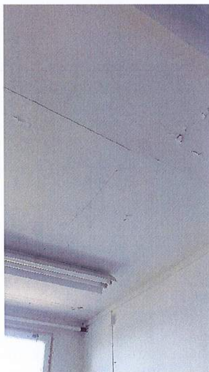
Fot 13. Sufit w części Sępólno