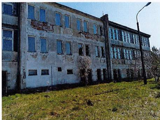
Fot. 5. Widok południowo-zachodni