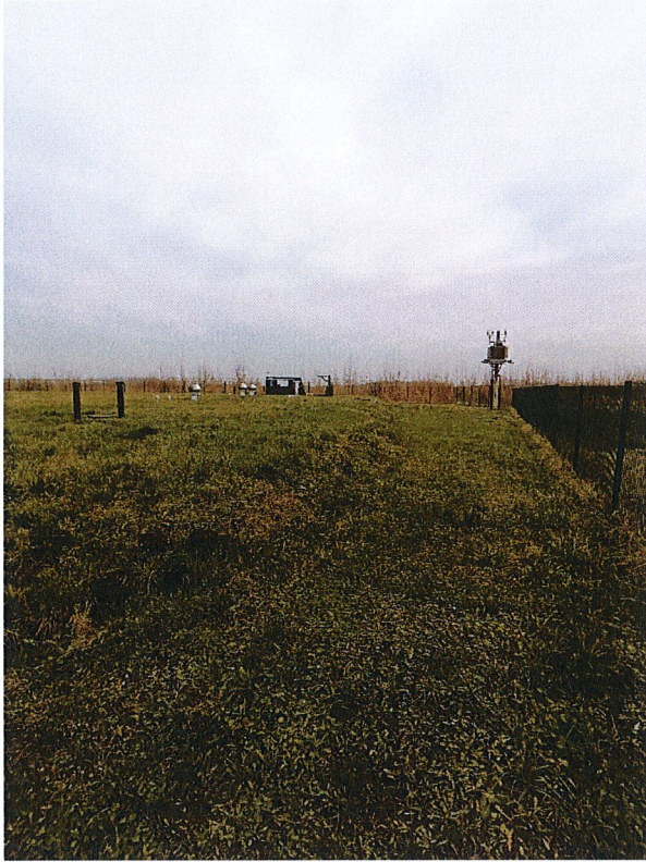
Fot.1 – Teren do utwardzenia