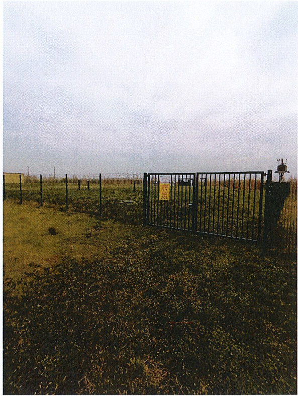
Fot.2 – Brama wjazdowa – teren do utwardzenia.