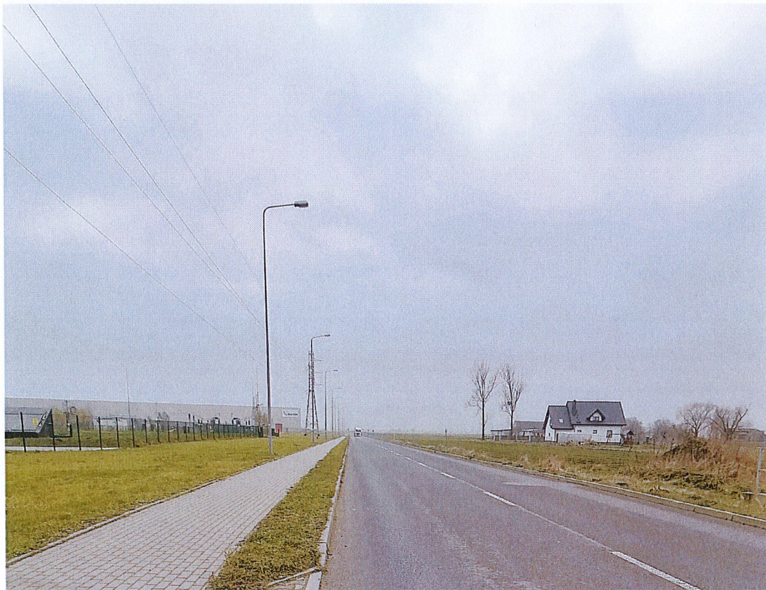
Fot.3 – Chodnik i jezdnia w rejonie planowanego utwardzenia terenu.